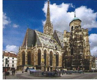
Stephansdom

Achtung: Reisepass, Führerschein oder Personalausweis mitnehmen!