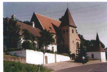
© Barth Erwin Kirche Heiligenblut, Niederösterreich