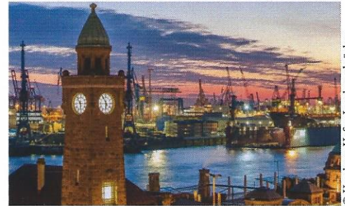
© Hamburg Häfen Landungsbrücken - Bild von KarstenBergmann auf Pixabay

Achtung: Reisepass oder gültiger Personalausweis erforderlich!