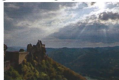
Ruine Aggstein

- Besichtigung Schloss Artstetten mit Führung