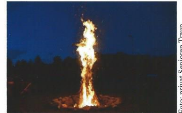
Senioren Traun

auf der Pfadfinderwiese in Oedt ab 17:00 Uhr