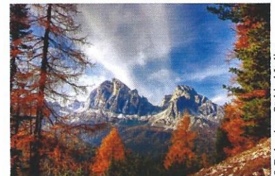
© Dolomiten Südtirol Italien - Bild von kordt_vahle auf Pixabay

Achtung: Reisepass oder gültiger Personalausweis erforderlich!