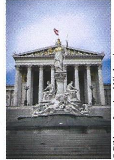
Parlament Wien