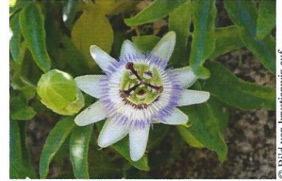
Passionsblume