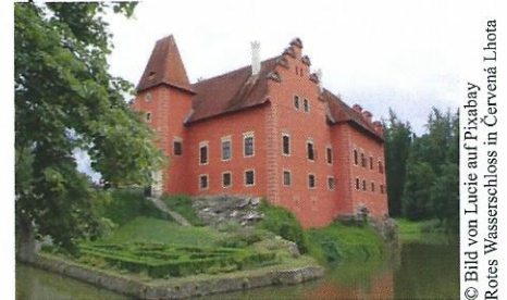
Rotes Wasserschloss in Cervená Lhota

Achtung: gültiger Reisepass oder gültiger Personalausweis erforderlich!